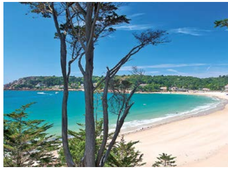
Endloser Sandstrand in der St. Brelade's Bay