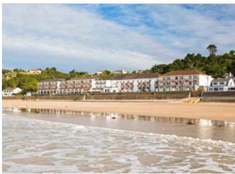
Ihr Hotel liegt direkt an der St. Brelade's Bay