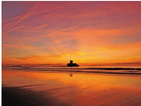
Sonnenuntergang über dem Atlantik