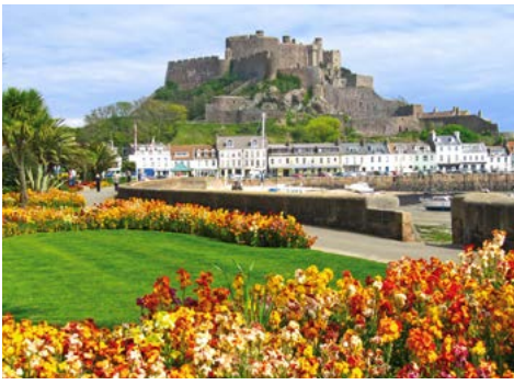
Jersey's Wahrzeichen: Mont Orgueil