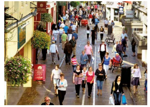
Shopping im charmanten St. Peter Port

dem – wie man sagt – „schönsten“ Fischerdörfchen der Insel sowie bei der zauberhaften Bucht „Bonne Nuit Bay“ mit ihrem kleinen, verträumten Fischerhafen beschließen Ihren heutigen Ausflug.