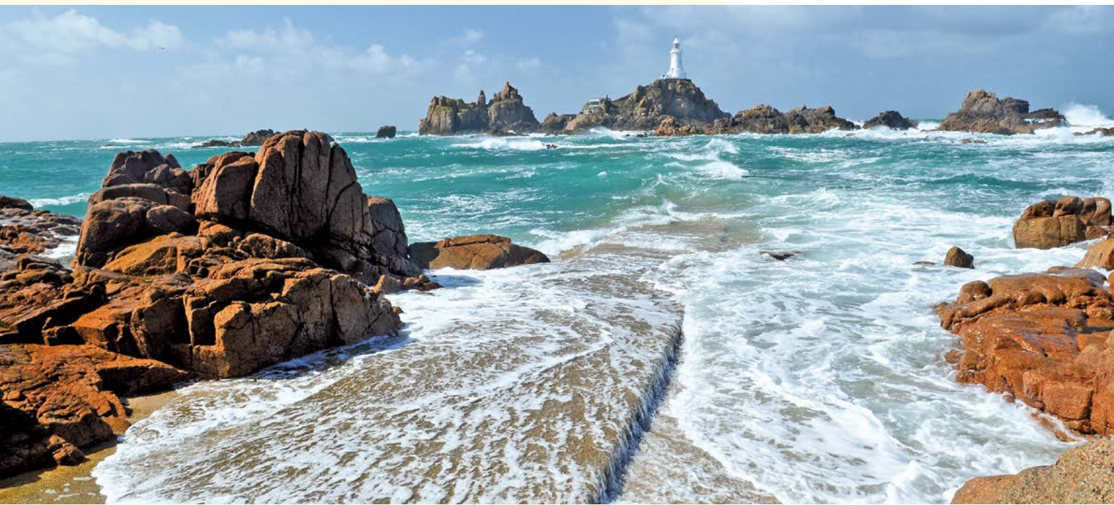
Meeresumspülter Felsenleuchtturm „La Corbière“

Ihr Ausflugspaket: St. Helier - St. Aubin - Brelade's Bay - Leuchtturm La Corbière - Weingut La Mare - Woodlands Farm - Gardenroute - Samares Manor - Mont Orgueil Castle