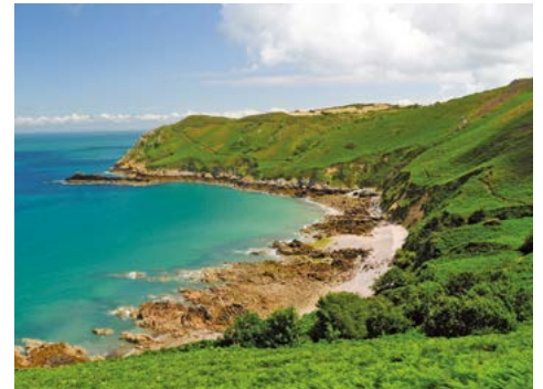
Grün bewachsene Felsküsten

08.06. - 15.06.19 • Flug ab/an Memmingen • ab € 1.795,- p.P. im Doppelzimmer