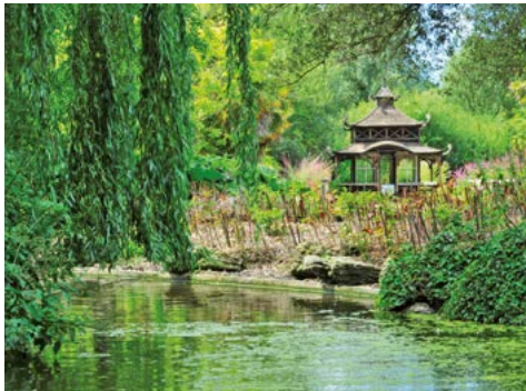
Japanischer Garten im Samares Manor